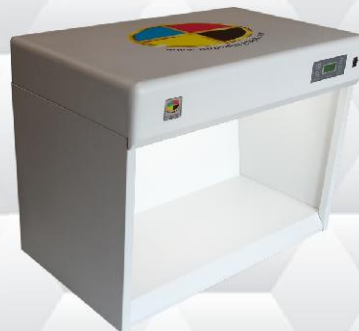
Cabina Controllo Metamerismo "CCM 600"