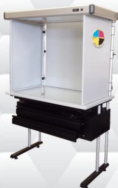
Tavolo Controllo Colore "TCC 1200"

Controllo visivo del film stampato / Visual inspection for printed film